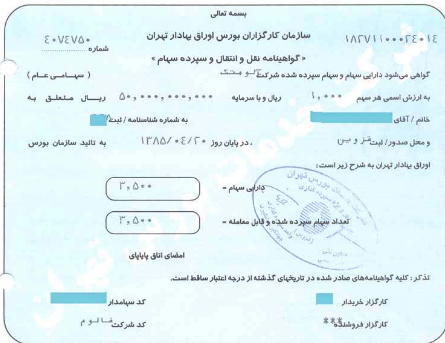
نمونه گواهینامه نقل و انتقال سهام - تالار اصلی