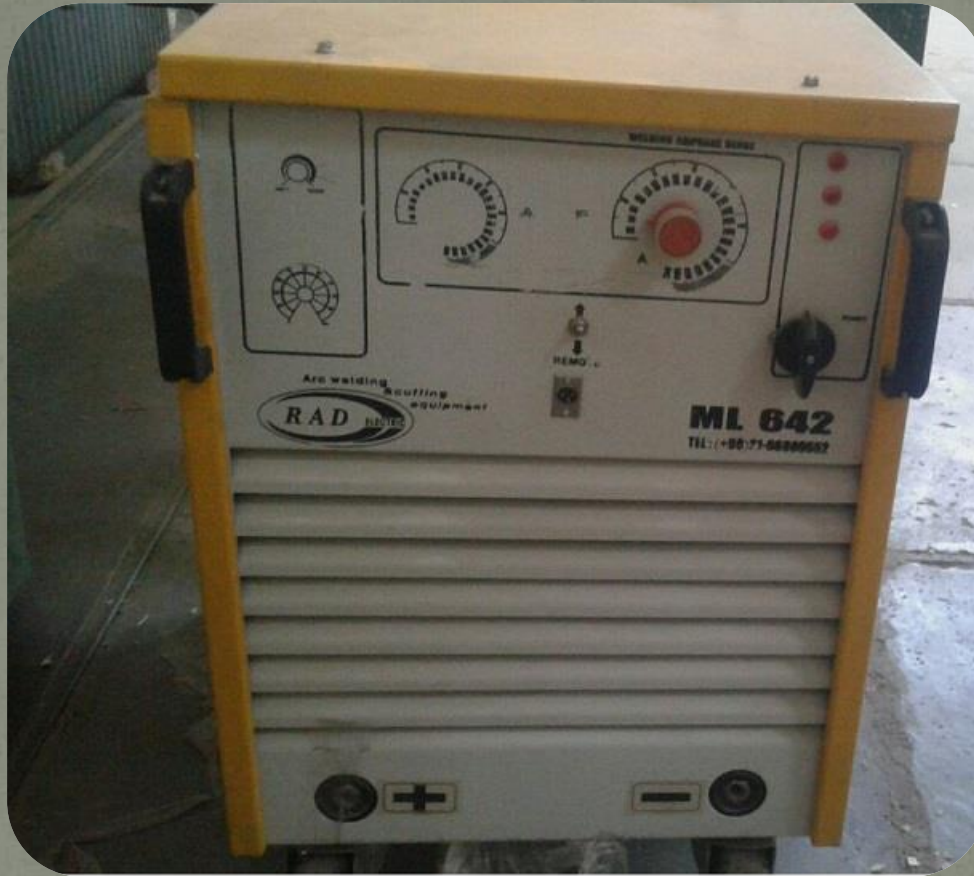
دستگاه رکتی فایر راد الکتریک - یک دستگاه