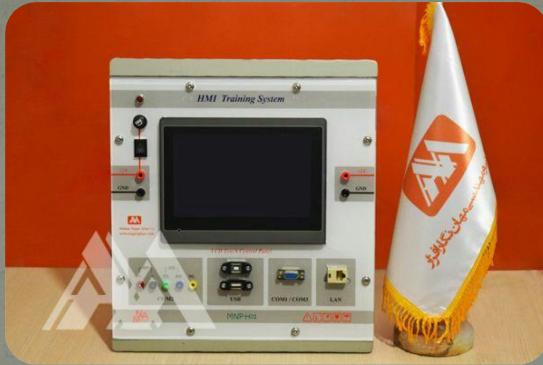
مجموعه آموزشی HMI