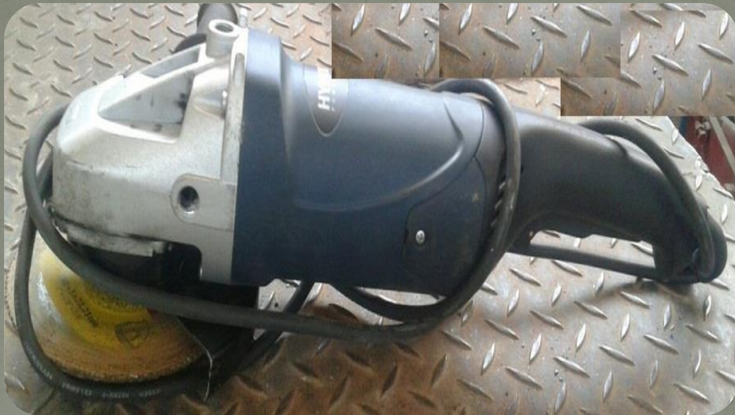
دستگاه فرز بزرگ هیوندای - اعدد