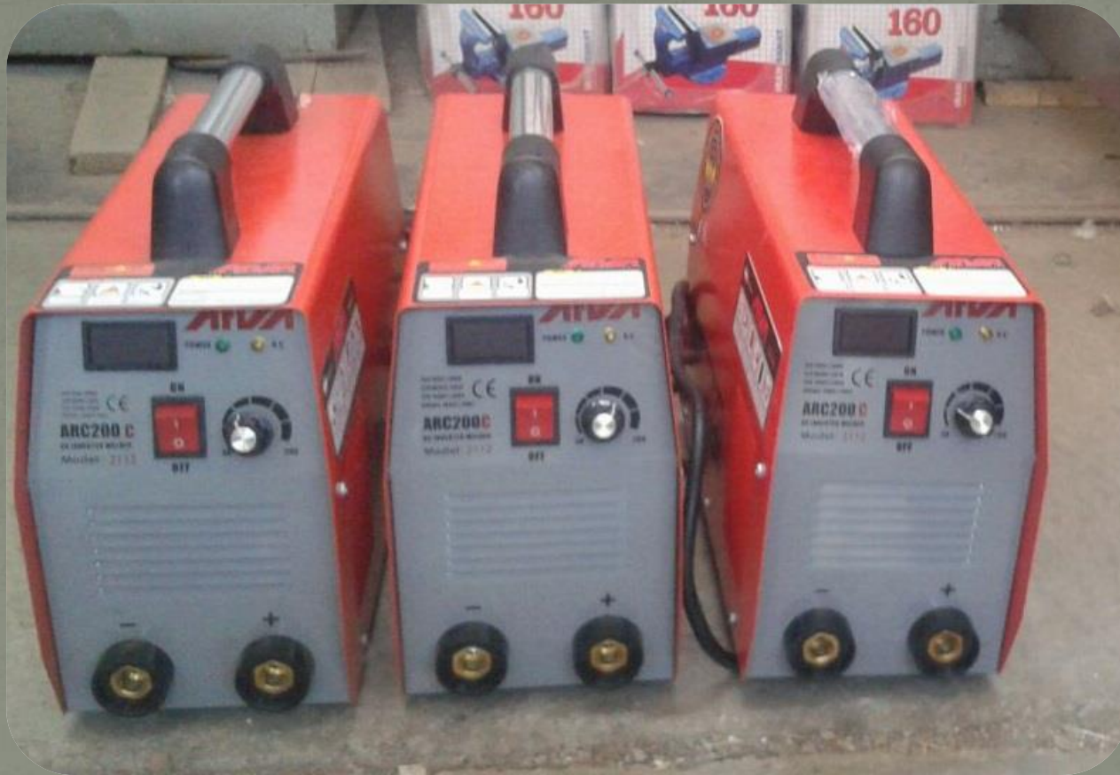
دستگاه اینورتر ۲۰۰ آمپر - ۳ عدد