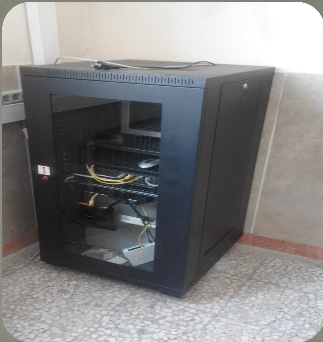
رک مونت شبکه - ۱ دستگاه