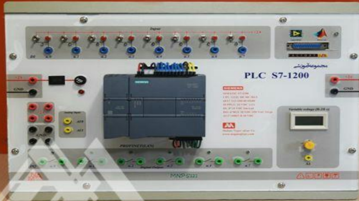
مجموعه آموزشی PLC-S7-1200